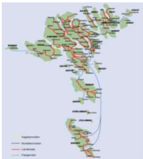
"Kort materiale Geodatastyrelsen"

Først i danske frimærker hvor den første dato med perfinbilledet V.L. perforeret heri er registreret med datoen 22.02.1935, og op gennem årene frem til datoen den 01.02.1974, - den foreløbige sidste registrerede dato af forfatteren registreret ( indtil andre tidligere datoer og årstal for dem begge er påvist ) fundet påstemplet et dansk frimærke perforeret med perfinbilledet V.L. ( Mere herom under afsnittet: Den foreløbige tidligste registrerede forstedato )