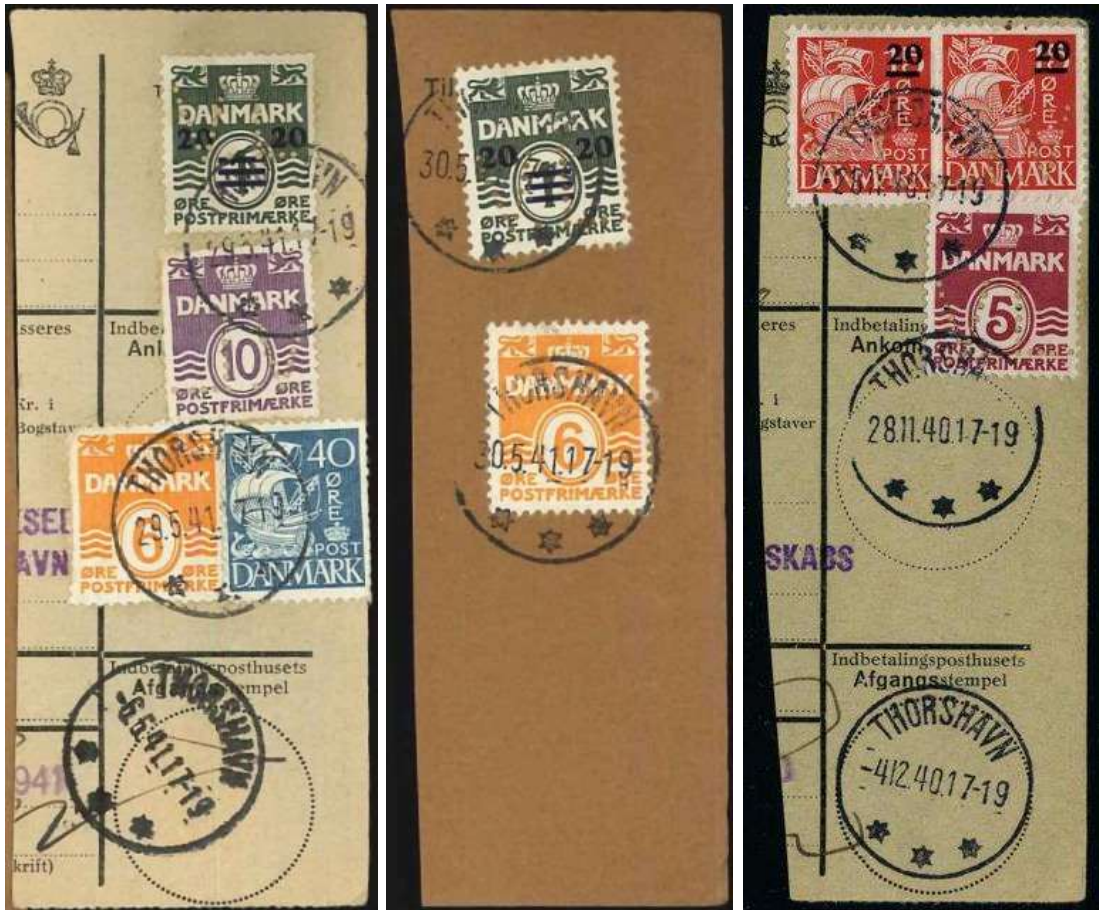
Klip fra Postindkasseringkort / Postanvisning